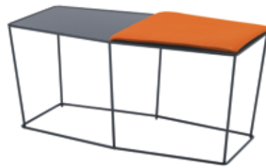
Mod. PF-041 + op. PF-072