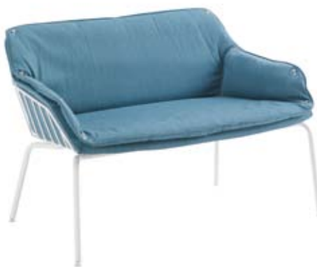
FRANK Mod. PF-034 + op. PF-069