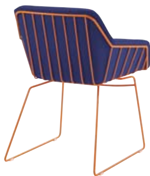
FRANK Mod. PF-016