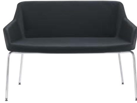
PAUL Mod. PF-133