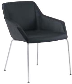
PAUL Mod. PF-103